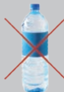
Bouteilles en plastique

Un doute ? N'hésitez pas ! Jetez dans votre poubelle habituelle