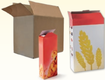
Les boîtes et les suremballages en carton