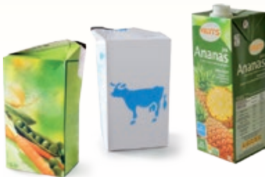
Les briques alimentaires : jus de fruit, soupe, lait...

Les cartons doivent être mis à l'abri dans le bac pour rester secs et être recyclés