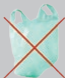
Sac en plastique

Ainsi que les papiers carbone, aluminium, sulfurisé, peint, photo, alimentaire