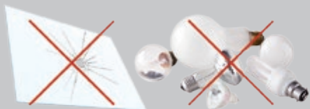
Miroirs, ampoules, vitres, néons