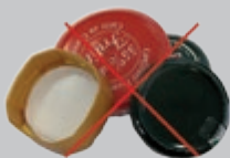
Bouchons, couvercles, capsules