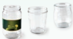
Les pots et bocaux