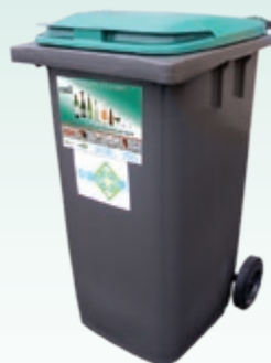
En habitat collectif