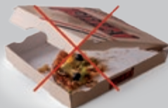
Cartons contenant des restes