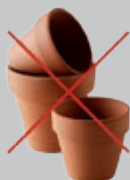
Pots en terre cuite