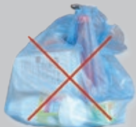
Sac contenant des emballages (à vider)