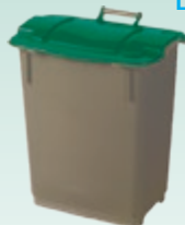
En habitat pavillonnaire