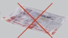
Film plastique enveloppant les revues